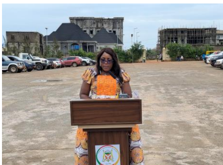
Mot de bienvenue du SG de la mairie de Yaoundé 7ème