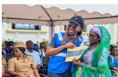
Le superviseur central et une mère mod-le de la vaccination