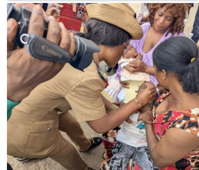
L'adjoint au sous-préfet vaccine un enfant