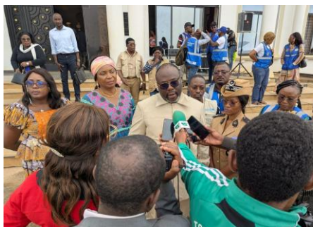
Le représentant de M. le Gouverneur répond aux questions de la presse