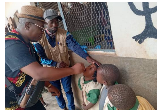
Administration du vaccin à une cible par l'autorité administrative