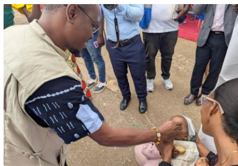
Le consultant UNICEF s'est prêt à l'exercice