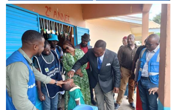
Administration du Nvpo2 par le Sous-préfet de Nkol-Afamba