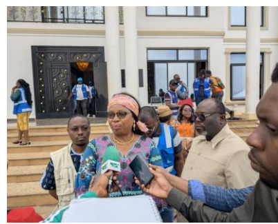
Mme le Délégué Régional face aux médias