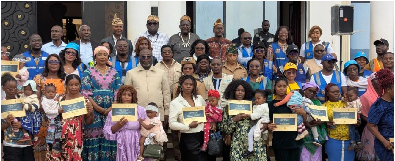
Cérémonie de lancement

« Stopper la circulation du polio virus sauvage dans la Région du Centre » tel est le message adressé aux populations par la représentation du Gouverneur lors de la Cérémonie de lancement de ce premier tour des Journées Locales de Vaccination contre la poliomyélite 2026.