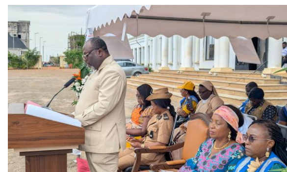
Allocution du représentant du Monsieur le Gouverneur