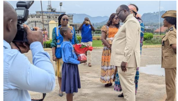
Accueil du Représentant de Monsieur le Gouverneur

L'administration solennelle du vaccin Nvpo2 aux enfants de 0 à 5 ans a été effectuée et au total près de 35 enfants ont été vaccinés à cette occasion. C'est par ce geste que le Représentant de Monsieur le Gouverneur et sa suite ont tenu à marquer le début de ce premier tour des Journées Locales de Vaccination contre la poliomyélite. Rendez-vous a été pris pour la suite de la vaccination dans les ménages pour la stratégie porte à porte, dans les marchés, les gares routières, les péages, lieux de culte et grands lieux de rassemblement pour la stratégie fixe-temporaire et dans les formations sanitaires pour ce qui est de la stratégie fixe.