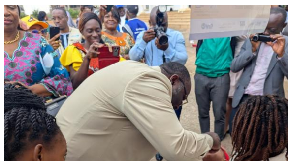
Administration solennelle du vaccin à une cible