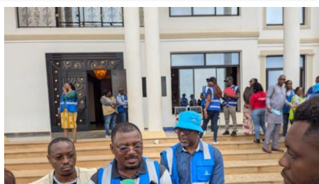
Le Coordonnateur Régional du PEV apporte son expertise aux journalistes