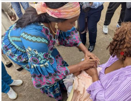
Administration du vaccin par Mme le Délégué Régional