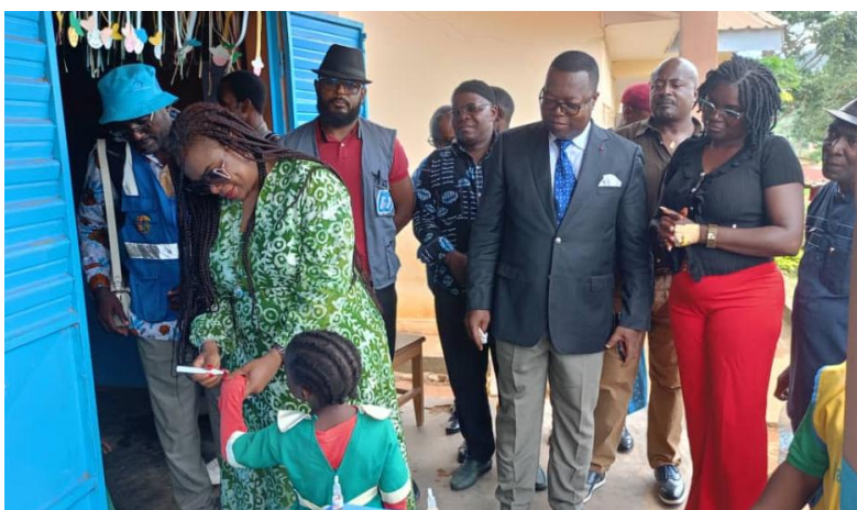
Administration du vaccin par le CDS de Nkol-Afamba