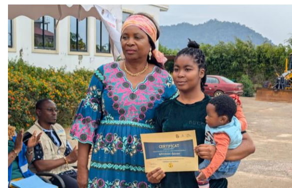
Remise de diplôme de satisfécit à une mère modèle par Mme le Délégué