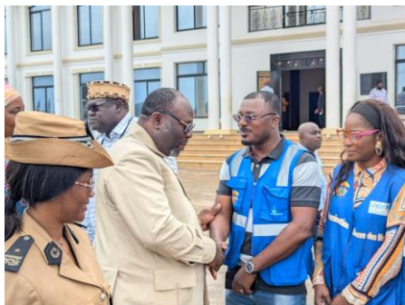
Le Coordonnateur Régional du PEV dans le comité d'accueil