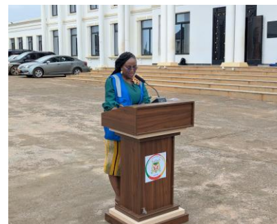
Mot de CDS de Nkolbisson