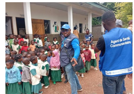
Mobilisation des enfants pour cérémonie de lancement à Ngambé-Tikar