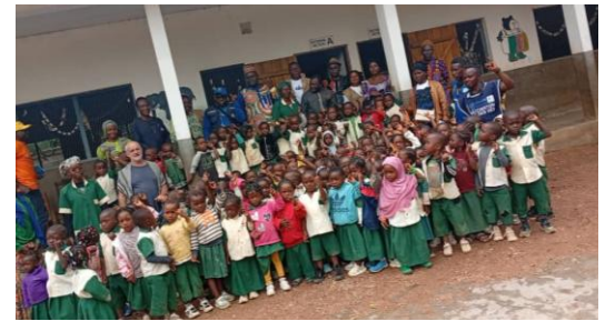
Cérémonie de lancement à l'école catholique de Ngambé-Tikar

Par Bela Onguene PFC District de Santé de Nkol-Afamba