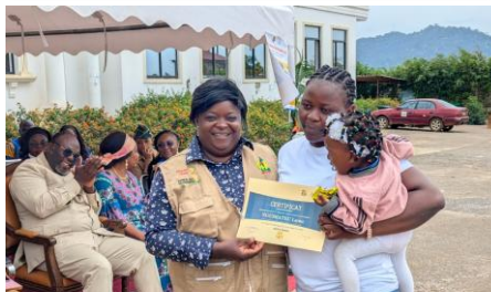
Le MINEDUB encourage les mères modèles de la vaccination